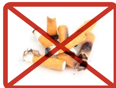
Tupakantumpit » sekajätteeseen