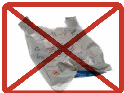
Muovipussit » muovipakkauksiin

muovipusseja- ja pakkauksia, lasia, metallia, vaippoja, hygieniatuotteita.