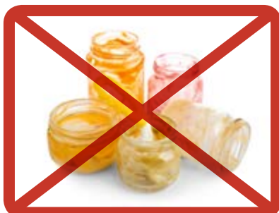
Lasipurkit » lasipakkauksiin