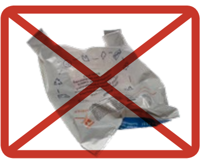
Plastpåsar » insamling för plastförpackningar

plastpåsar och -förpackningar, glas, metall, blöjor, hygienprodukter.