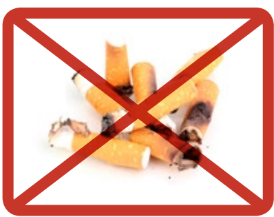
Tobaksfimpar » blandavfallet