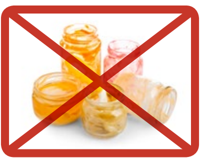
Glasburkar » insamling för glasförpackningar