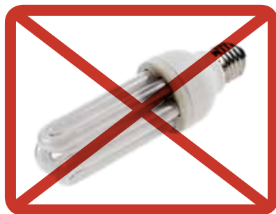
LED- och energisparlampor, lysrör » insamlingen av elapparater eller farligt avfall