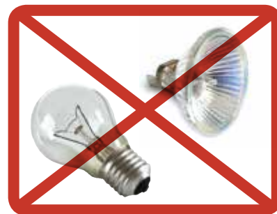
Halogen- och glödlampor » blandavfallet