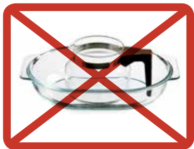
Glaskärl » blandavfallet

glaskärl, glasföremål, lampor, porslin eller keramik.